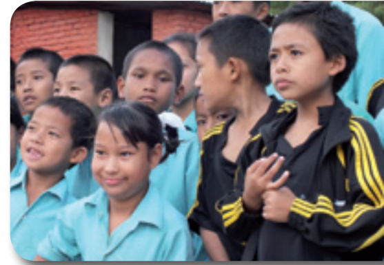
Die Kinder präsentieren stolz ihre neue Kleidung.

herzlich für die Spenden, die den Kindern ein schönes Fest und ein Aufwachsen in einer relativ geordneten Welt ermöglichen!