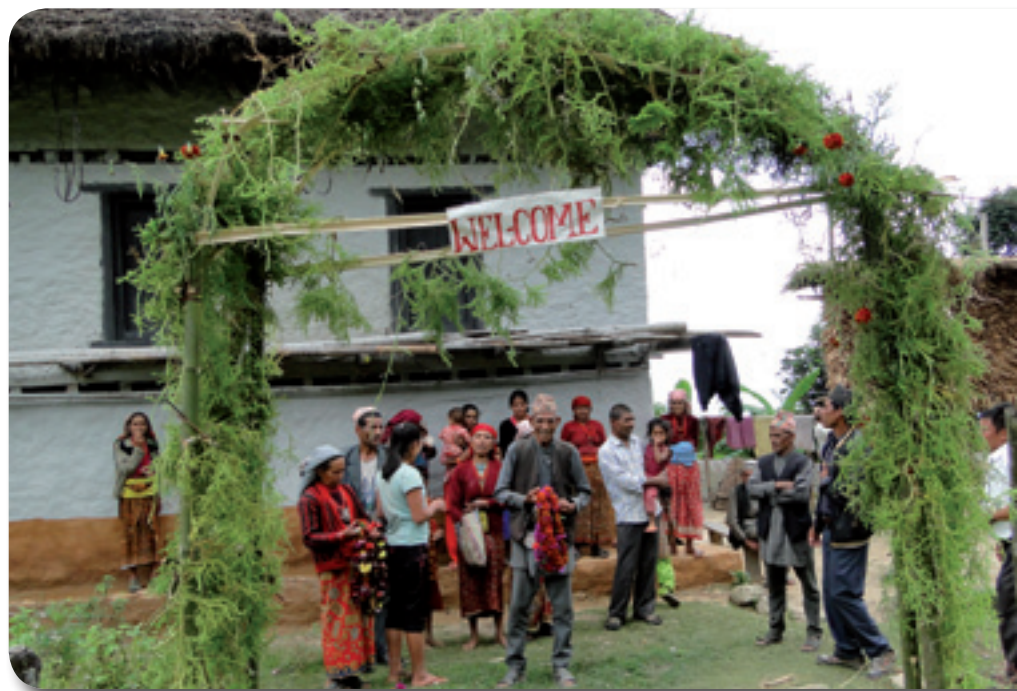
Herzliches Willkommen in Bakachol.

Große Fortschritte wurden auch im Bereich Dorfentwicklung gemacht. Die Dorfgruppen treffen sich monatlich in den einzelnen Siedlungen und besprechen ihre Arbeit. Auch das Management der Kleinkreditprogramme für Frauen und Männer liegt völlig in den Händen der Dorfbevölkerung und funktioniert reibungslos. Meist werden die kleinen Summen für den Kauf von Hühnern oder Saatgut verwendet – somit ist ein Beitrag zur Einkommensförderung gewährleistet.