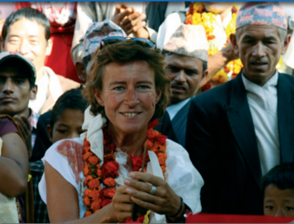
Das Community Health Building in Pawai wird eingeweiht.